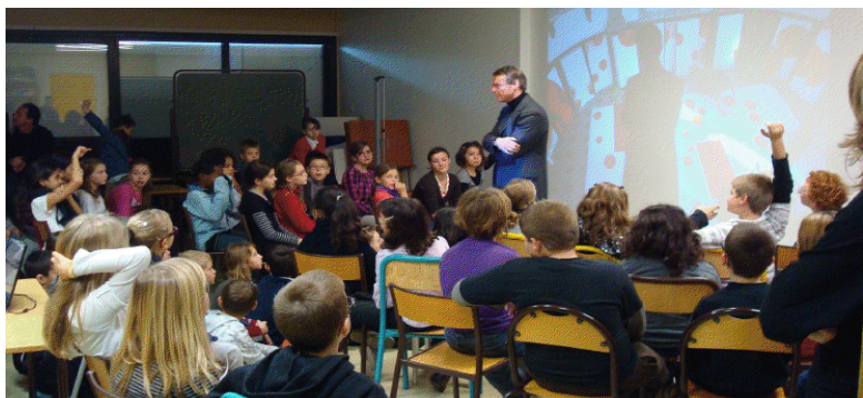
Rencontre avec Guillaume Bottazzi / Ecole Lucie Aubrac à BlanzY

Ces rencontres permettent de favoriser les échanges avec les résidents et notamment avec des jeunes. L'œuvre est un outil de médiation et de cohésion qui permet aux participants de se rencontrer autrement. Les résidents sont flattés d'avoir droit à une intervention artistique qu'ils retrouvent à l'extérieur de la résidence.