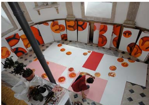
Projet en cours de réalisation en atelier

Guillaume Bottazzi a déjà conçu et réalisé une trentaine d'œuvres sur sites spécifiques. Ses œuvres, souvent monumentales, ne sont jamais figées dans le sens ou les observateurs évoluent elles et réagissent différemment dans le temps.